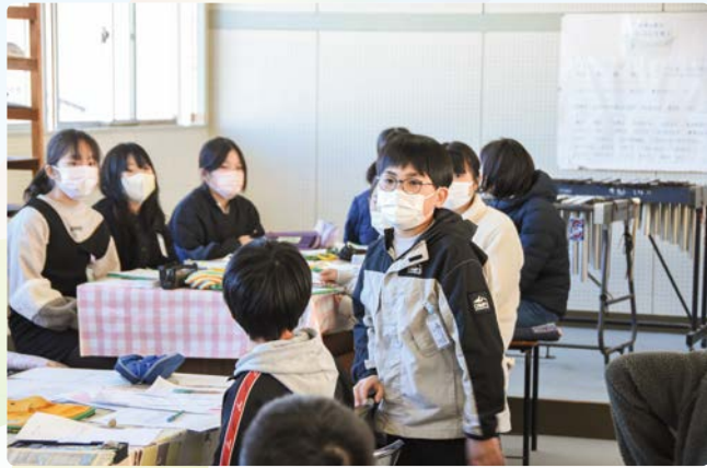
▲取材では何枚くらい写真を撮るんですか？