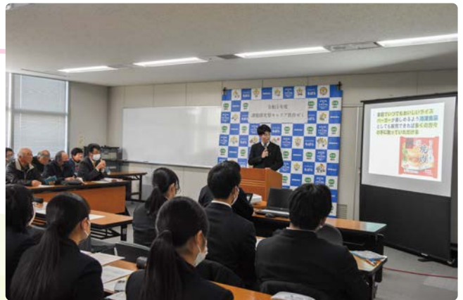
▲委員の方も真剣な眼差しで提案を聞きます