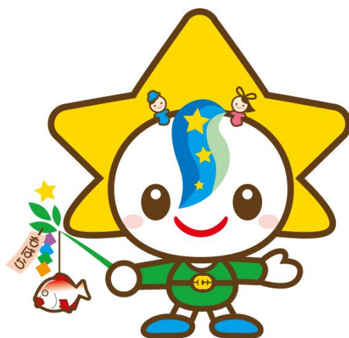
茂原市マスコットキャラクター モバリん