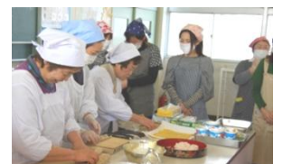
太巻き寿司の作り方を実践講習 (いきいき三代交流会)