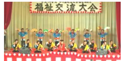
福祉交流大会で太鼓を披露する 銭太鼓道目木鞠枝鼓蝶会の皆さん