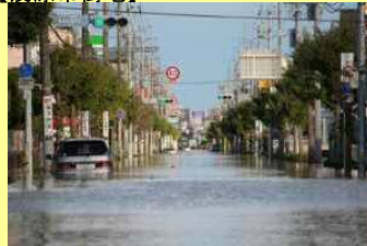
平成25年10月台風26号時の影響 【茂原市街地】

こうした浸水被害の状況を踏まえ、「100mm/h安心プラン」で対象とする降雨は平成25年10月15日～16日の台風26号(24時間最大雨量289mm、6時間最大雨量138mm、最大時間雨量51mm)とした。なお、この台風を対象とする整備により、平成24年8月6日の最大時間雨量61.5mm(既往最大)に対しても被害軽減効果は期待できる。