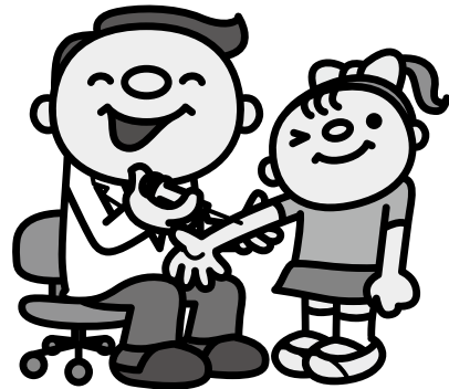
予防接種を受けましょう