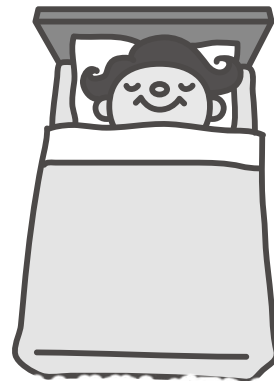
日頃から十分な休養とバランスよく栄養をとり、抵抗力を高めましょう