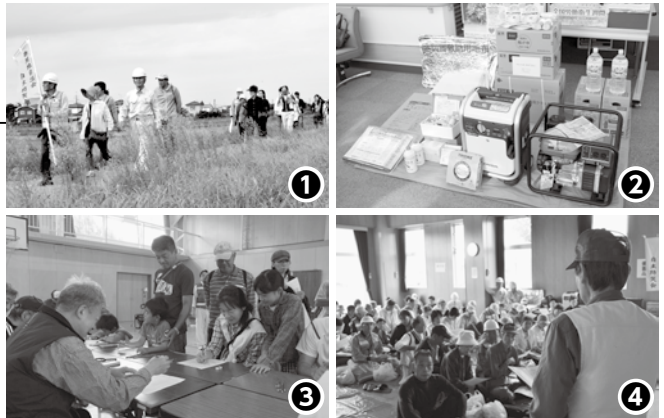
▲①避難する住民②備蓄品の展示③避難者カードを記入する住民④災害対策コーディネーターの話を真剣に聞く住民

街頭啓発では、チーバくんやモバリんをはじめ長生郡内のマスコットキャラクターたちも応援に駆け付け、買い物客に交通安全を呼びかけました。