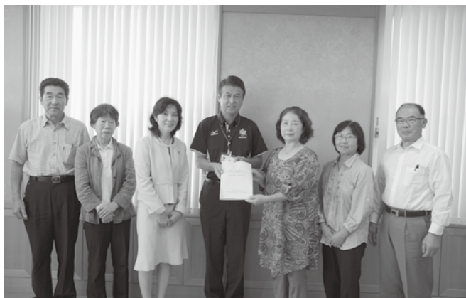
▲同協議会は、学識経験者、市議会議員、一般公募による委員で構成されています

今回から初めて住民参加型の避難所設営を中心とした訓練を実施。参加者は、自宅での避難行動をとった後、自治会内で集まり、それぞれの避難所に移動しました。その後、協力して避難所設営や運営ができるよう、本番さながらの雰囲気の中、必要な役割を確認しました。