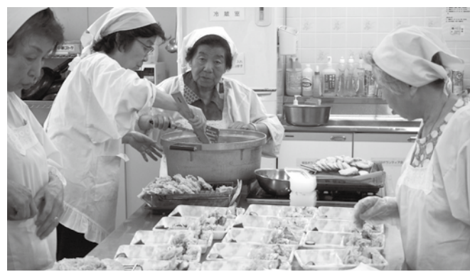
▲お弁当を作る「東部ボランティア会」の皆さん

近年、私たちの社会においても、身近な地域や学校、企業といった様々な場面で福祉や環境、国際協力などのボランティア活動に参加する人々が急速に増加し、多様な広がりを見せています。「個人の自発的な意思」から始まるボランティア活動には、決まった形はありません。いつでも自分のできることから参加できます。