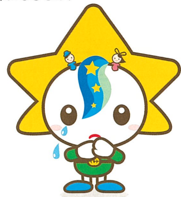
茂原市マスコットキャラクターモバリん