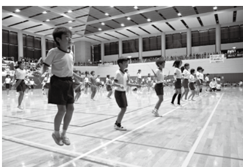
僕と私のジャンピング大会

○第21回僕と私の ジャンピング大会 11月23日(日)9時10分～ 市民体育館