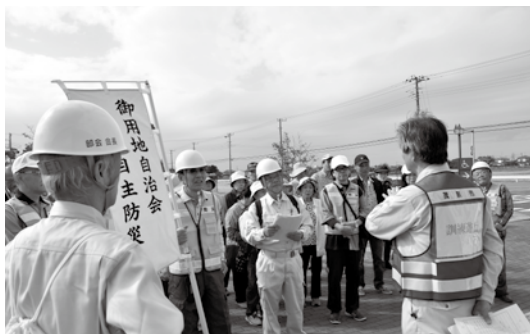
▲昨年の地域防災訓練

災害はいつ、どこで起きるかわかりません。いざというときに十分な対応をとるには、地域住民自らが日頃の備えの重要性を認識し、災害時の行動力向上を図ることが必要です。そこで、自分の身を守る「自助」と地域で協力して助け合う「共助」を中心とした地域防災訓練を次のとおり行います。