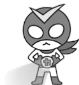
確認戦士カクンダー