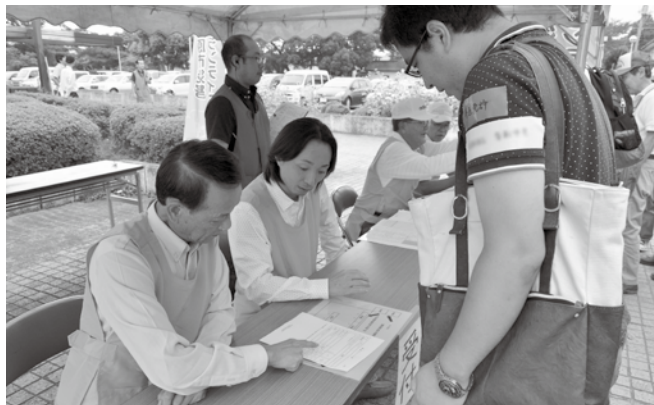
▲受付班によるボランティア活動希望者の受付