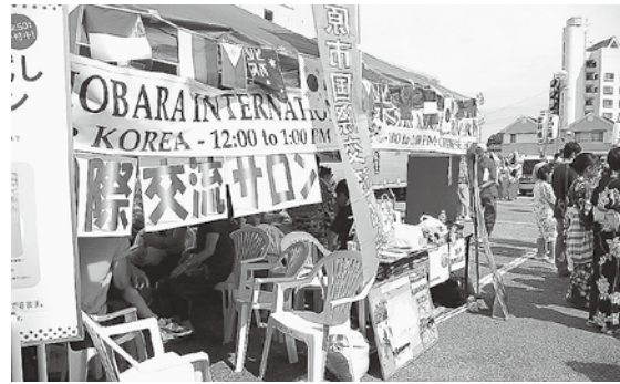
茂原七夕まつり「国際交流サロン」

また、外国人向けの日本語講座だけでなく、市民向けに中国語・韓国語・英語の講座も開いています。この機会に学んでみませんか? MIFAの主な事業は、毎年行われる、「茂原市国際交流パーティー」です。世界の料理の紹介やダンスの披露、コスチュームショーなどが行われ、昨年の参加者は144名を数え、年々参加者が増えています。