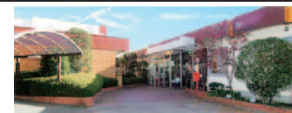
特別養護老人ホーム 長生共楽園 ☎0475-22-1888 茂原市下永吉2812 [エリアマップ13図A-2]