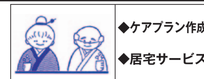
◆ケアプラン作成 ◆居宅サービス 居宅介護支援センター ☎0475-22-8866 茂原市下永吉2812 [エリアマップ13図A-2]