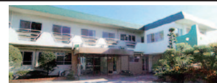
養護老人ホーム 長生共楽園 ☎0475-24-2207 茂原市下永吉2812 [エリアマップ13図A-2]