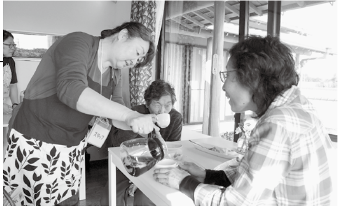
▲500円で手作りのデザートと飲み物が提供されます

初日から多くのお客さんが訪れ、皆、和やかな雰囲気でも過ごしていました。「あぜみち」は、毎月第2水曜日の午後に利用できます（市内弓渡1300-4）