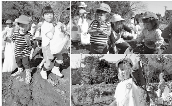
▲夢中でイモ掘りを楽しむ園児