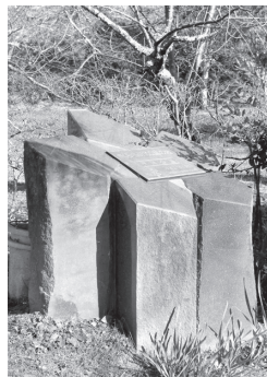
さくら名所100選のプレート

茂原公園内の桜はソメイヨシノが主力(約二、一三〇本)ですが、異なる桜もあります。サトザクラ、ヤマザクラ、フユザクラ、リュウキュウヒガンザクラなどです。三月末から四月にかけて、酒盛橋から川沿いに約三キロ以上にソメイヨシノが咲き誇ります。