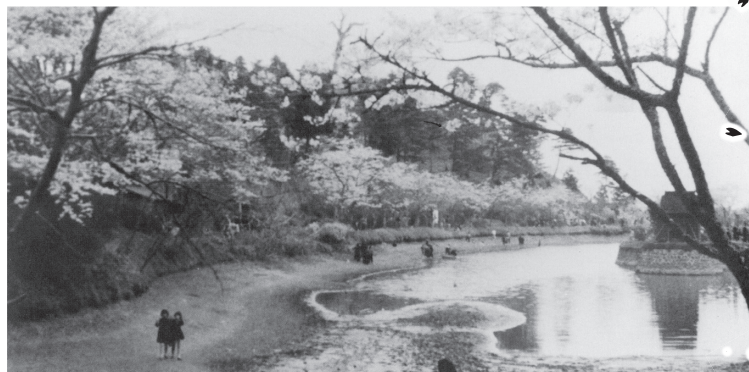
昭和35年 春の茂原公園

拓の追憶の碑があります。昭和十一年には静和女学校(現茂原高校)の生徒が公園内の池(現弁天湖)で水泳練習をしたとの記録も。その後茂原町保勝会(ほしょうかい)の組織が、植樹や管理をしていました。戦時下は活動も休止、戦後昭和二十五年に観光協会が事業を引き継ぎました。平成二年にさくら名所百選の選定記念交付プレート設置と記念樹として花弁の大きい千原桜を植えました。この桜はオオシマザクラの祖先にあたり学術的に貴重なものと言われています。