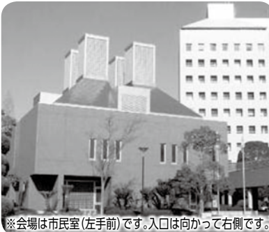
※会場は市民室(左手前)です。入口は向かって右側です。

〒297-8511 茂原市道表1番地 ☎(20)1577 FAX(20)1609