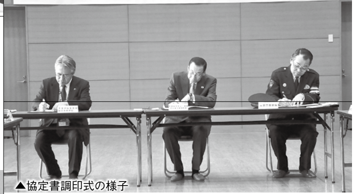
▲協定書調印式の様子