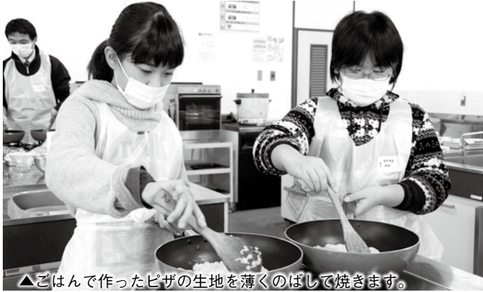
▲ごはんで作ったピザの生地を薄くのばして焼きます。

市職員の指導のもと、参加児童らは協力しながら調理し、残りごはんはお好み焼き風、ピザ風、おはぎ風のおやつに早変わり。楽しくて美味しいおやつの時間になりました。