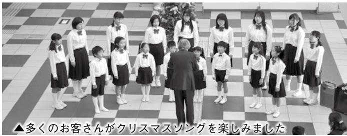
▲多くのお客さんがクリスマスソングを楽しみました

「アヴェ・マリア」や「サンタが町にやってくる」、「We wish you a Merry Christmas」など、全14曲が披露され、クリスマスの雰囲気を盛り上げていました。