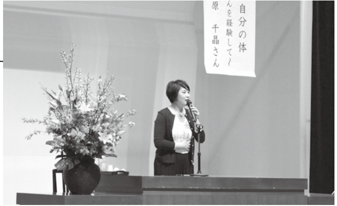
▲自身の体験を強い想いで話されました

「病気は家族を巻き込む。自分の体は自分にしか守れません」。女性として自分の身体と心を守る大切さを伝えていただきました。