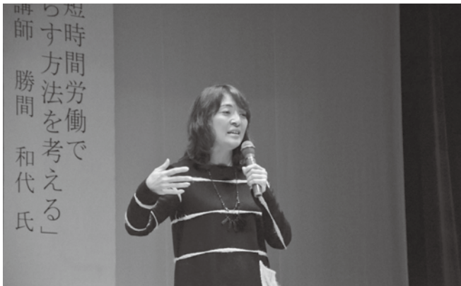
▲講演には680人が参加しました