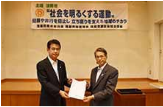
▲内閣総理大臣のメッセージを手渡す茂原市保護司会会長（右）

なお、平成28年6月15日、社会を明るくする運動茂原市推進委員会が開催されました。推進委員会には、茂原市保護司会・更生保護女性会・自治会長連合会等、総計17団体の代表者が委員として参加し、社会を明るくするための方策を話し合います。