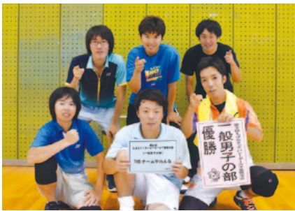
一般男子の部優勝 TVBチームやれんな