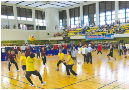
▲熱戦のタッチバレーボール