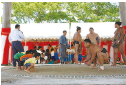
子ども達が力士に挑戦