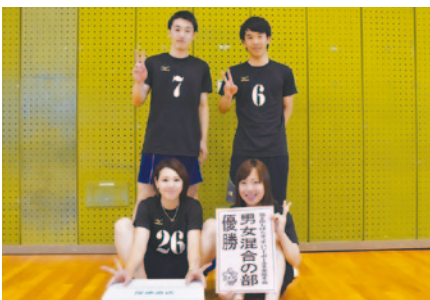
男女混合の部優勝 C.V.C