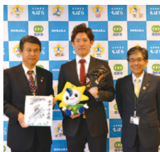
1月に表敬訪問に訪れた高梨投手

萩原小→茂原中→土気高→山梨学院大→北海道日本ハムファイターズ(2013年ドラフト4巡目入団)