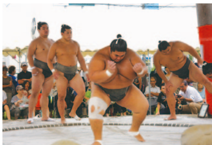
迫力ある稽古様子