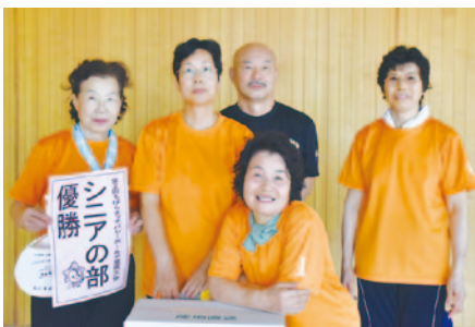
シニアの部優勝 チェリークラブ