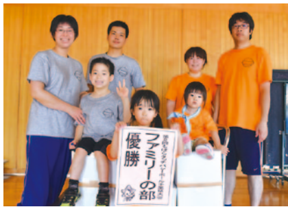
ファミリーの部優勝 UC☆GLAY