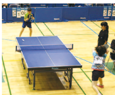
全国大会出場 中山 恭花さん(卓球)