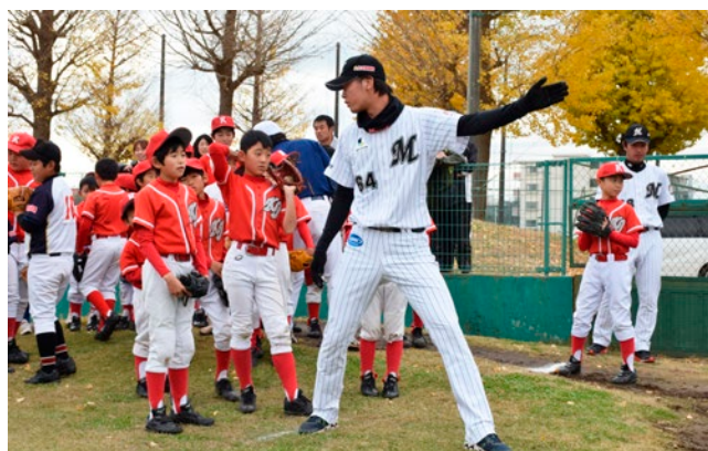
▲動作を交えてのピッチング指導