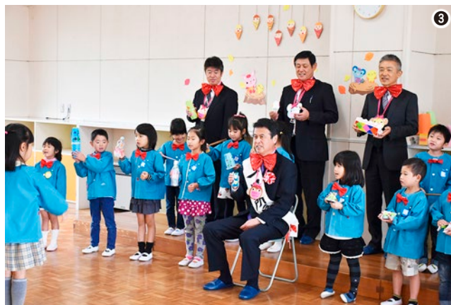
▲①フラッグとパネルを使った歓迎セレモニー ②手遊びをして盛り上がりました ③みんなでリズムに合わせて演奏