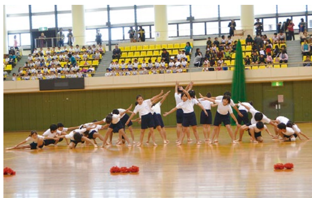
▲〔優秀賞〕小学校の部「～探検・八幡山へ行こう～」(鶴枝小4年)