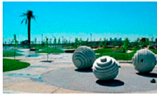
▲MOBARA PARK (茂原公園)

滞在中は、オールドリッジ市長との意見交換や、市議会、博物館、競技場等の施設の視察を行いました。また、姉妹都市の証として市内に建設された「MOBARA PARK（茂原公園）」で毎年開催されている「MATSURITONMOBARA（茂原まつり）」に参加しました。着物や、相撲、居合、空手等の日本の文化が紹介され、市民の皆さんから盛大な歓迎を受けました。