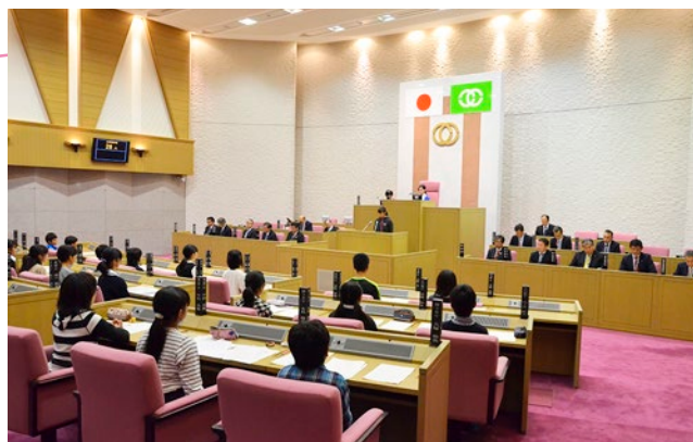
▲気持ちも姿勢も真っ直ぐ前を向いて

代表14人による本物の議会さながらの一般質問が行われ、茂原を想う気持ちと緊張感がヒシヒシと伝わってきました。