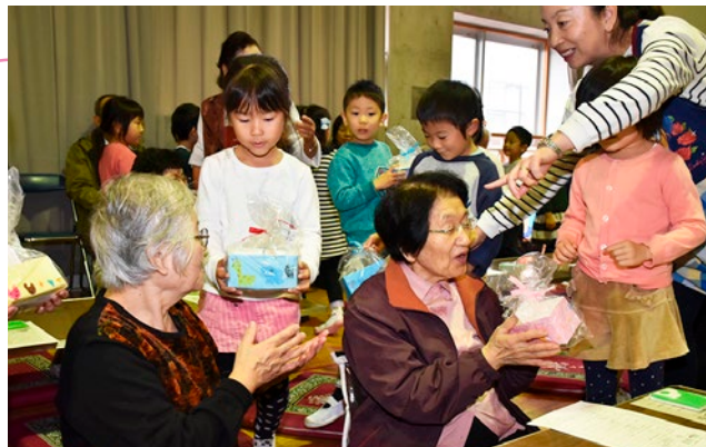
▲園児らからプレゼントをもらう参加者

これは、同協議会が毎年行っているもので、今年で19回目。園児の歌や遊戯、歌謡ショーなど盛りだくさんの内容で、参加者は皆いきいきとした表情をしていました。