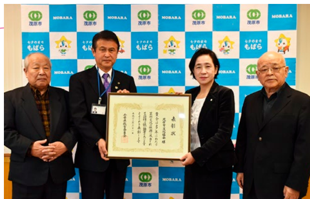
▲茂原市文化協会は、昭和63年に設立されました

この表彰は、永年にわたり、千葉県の教育・文化の発展に寄与した個人及び団体に贈られるもの。茂原市文化協会は、市内の芸術文化団体の相互理解を深めるとともに、芸術文化の振興、発展に寄与したことなどが評価され受賞となりました。