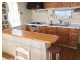
ダイニング・キッチン