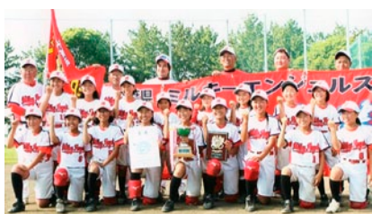
ミルキーエンジェルズのみなさん

5月28日に行われた第31回全日本、第34回関東小学生男女ソフトボール千葉県予選大会女子の部でミルキーエンジェルズが優勝し、全国大会出場を決め、併せて関東大会出場を果たしました。