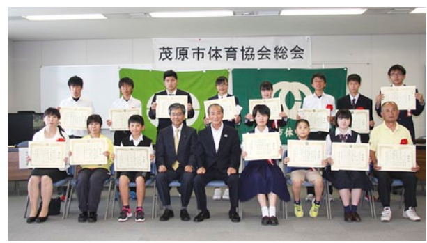
受賞記念の集合写真

国民体育大会や千葉県民体育大会等、各種大会において優秀な成績を残された選手および団体の表彰式が、5月21日に行われました。今年度は優秀選手18人、優秀団体2団体の表彰がありました。受賞者は次のとおりです。