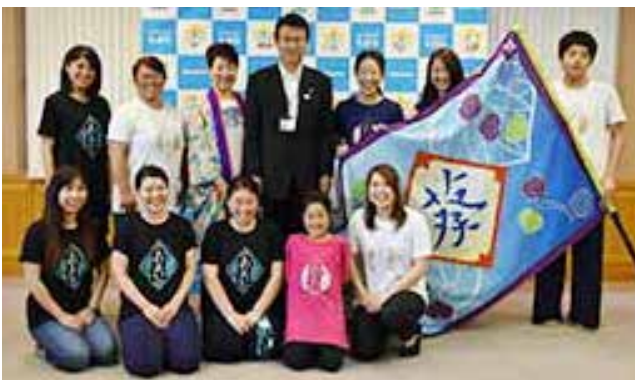
▲今月末の七夕まつりでは新作も披露される予定です