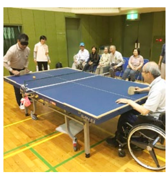
サウンドテーブルテニス