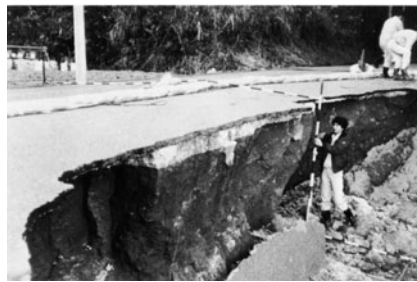
真名ゴルフ場入口道路の亀裂

東日本大震災でも、計画停電など、大きな影響がありました。平成23年には『茂原市地震防災マップ』が各戸に配布されました。