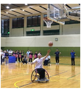
車椅子バスケットボールの体験

パラスポーツ教室(障がい者スポーツ)を実施 平成29年6月12日を皮切りに、全10回のパラスポーツ教室が始まりました。講師として今年度設立された障がい者スポーツ支援団体「パラスポーツ茂原」の障がい者スポーツ指導員の指導のもと楽しく行われています。教室初日には約60人の参加者が集まり、車椅子バスケットボールの体験や、サウンドテーブルテニスの体験を行いました。この教室は、障がい者スポーツ指導員を目指す方も、ぜひご参加ください。