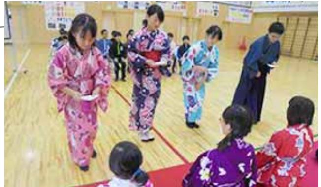
▲一つ一つの動きにも作法があります