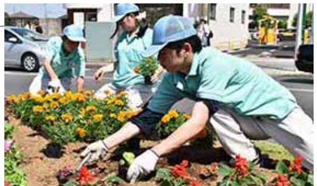
▲7月の「農業クラブプロジェクト研究発表大会」で発表されます

これは、同校の地域連携活動の一環で、毎年春と秋に実施。今回は、1月から生徒たちが花壇のデザインを考え、2月から学校で育てたマリーゴールドやペチュニアなどを植えました。