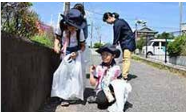
▲市内中心部を2コースに分かれて収集しました