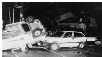
吹き飛ばされた自動車

竜巻は、台風、低気圧や前線、寒気の流入などに伴い積乱雲ができるときに多く発生します。雷や豪雨を伴うことが多い、頑丈な建物の中に避難することが大事です。屋外では樹木や電柱などから4m以上離れ、身体を低くして安全を図ります。