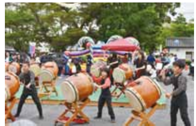
▲鮮やかなパチさばきです

和太鼓を通してさらなる『元気』を与えられるグループを目指す「中の島太鼓」。最後に「興味のある方、一緒に和太鼓を叩きましょう！」と力強く語ってくれました。