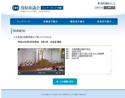
▲次回9月議会は9月6日(水)開会です

市議会では、『市民に開かれた議会』の実現に向けて、積極的な情報公開を推進するため、本会議のインターネット中継を実施しています。