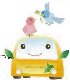
エコドライブキャラクター 「エコ丸クン」