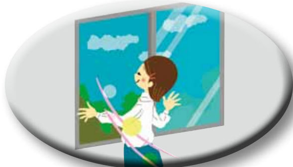
室内では加湿と換気を よくしましょう