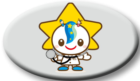
予防接種も予防方法の 一つです