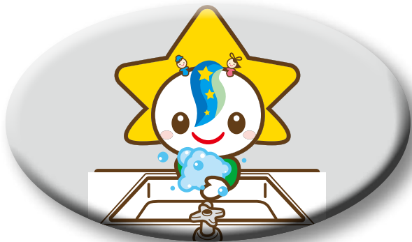
手洗いうがいをこまめに しましょう