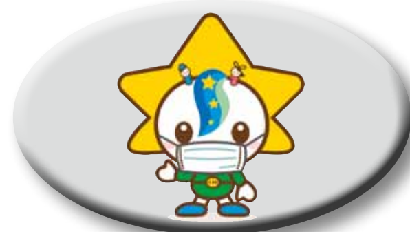
マスクを着用しましょう