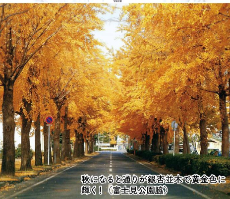
秋になると通りが銀杏並木で黄金色に輝く!(富士見公園脇)