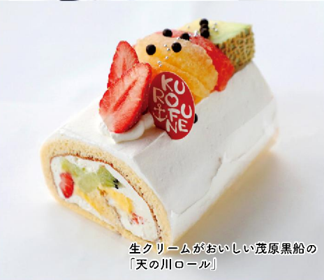
生クリームがおいしい茂原黒船の「天の川ロール」