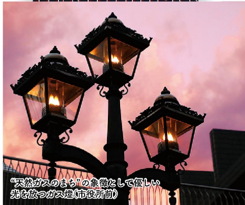
「天然ガスのまち」の象徴として優しい光を放つガス燈(市役所前)