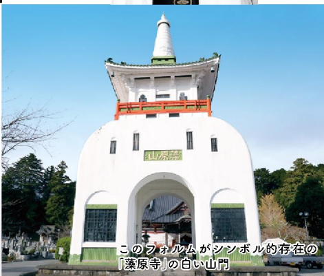
このフォルムがシンボリック存在の「浄原寺」の白い山門