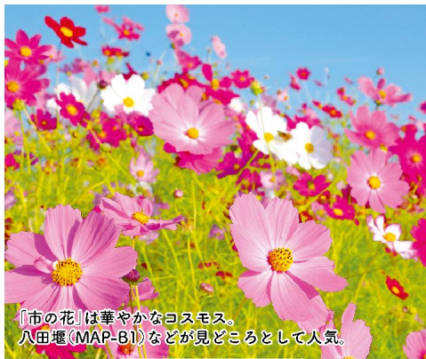
「市の花」は華やかなコスモス。八田郷(MAP-B1)などが見どころとして人気。

わがまち、「茂原のいいところって何!？」と尋ねられたら、あなたはへと答えますか? そんな質問を投げかけた市民ワークショップで、出てきたクチコミ情報はなんと、145! ここで一気に紹介します!! 場所は裏表紙の「いいところMAP」でチェック!