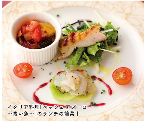
イタリア料理「ベッジョアズーロ〜青い魚〜」のランチの前菜!