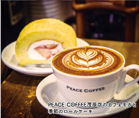
PEACE COFFEE茂原店のカフェモカと季節のロールケーキ