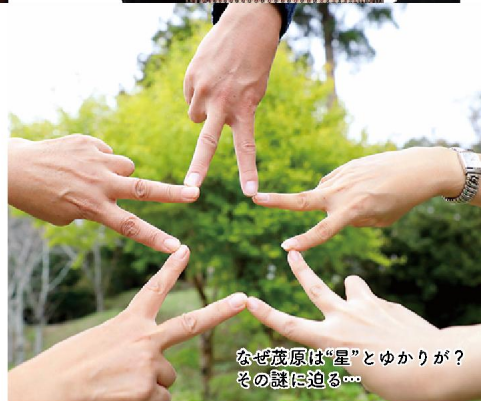
なぜ茂原は「星」とゆかりが? その謎に迫る...