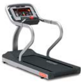
▲ランニングマシン

・ストレッチマシン4台ほか ◆更新された機器 ・ランニングマシン ・エアロバイクほか