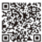
▲協会ホームページ 二次元コード