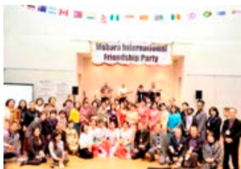
▲昨年の国際交流パーティーでの1枚

・相互理解を深める国際交流バーベキューやバスツアー ・外国人向けの生活支援事業（救急救命講習、交通安全