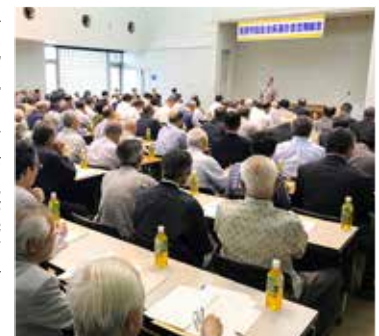
▲自治会長連合会の定期総会