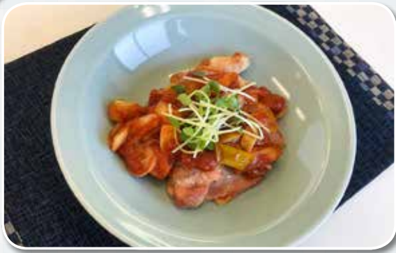
「鶏肉のトマトソース煮」