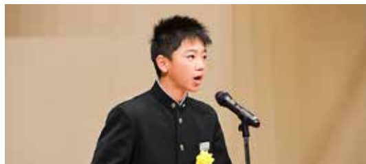
▲少年の主張大会では、中学生14人が発表