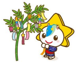
茂原市マスコットキャラクター モバリん

茂原市では、地域の身近な課題（まちづくり、環境保全、地域安全、子どもの健全育成など）を、市民活動団体ならではの発想やアイデアを活かして、行政と協働で解決しようとする事業の提案を募集します。