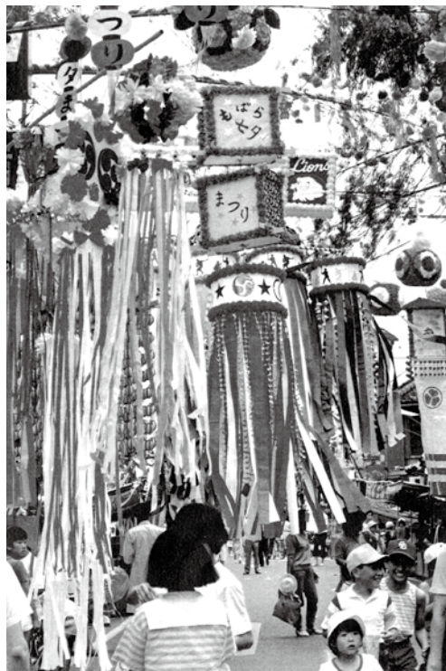
▲第30回茂原七夕まつりの様子

右の写真は最近の七夕で見かけた若い人のゆかた姿です。ゆかたは浴衣と書き、古くは湯帷子(ゆかたびら)と呼ばれ、風呂上りに着た衣でした。今は木綿の単衣で、夏のおしゃれ着のようです。最近の本には遊衣との表記もあります。 今、鶴枝公民館の活動で「和裁クラブ」があり、ゆかたも縫っているとのことなので取材をして来ました。