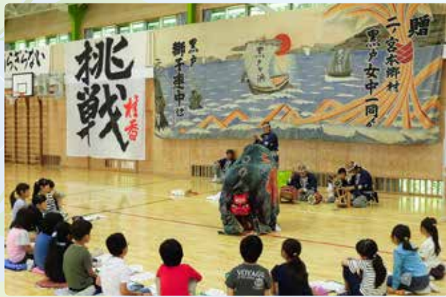
▲児童から「伝統を守りたい」との力強い言葉も!!