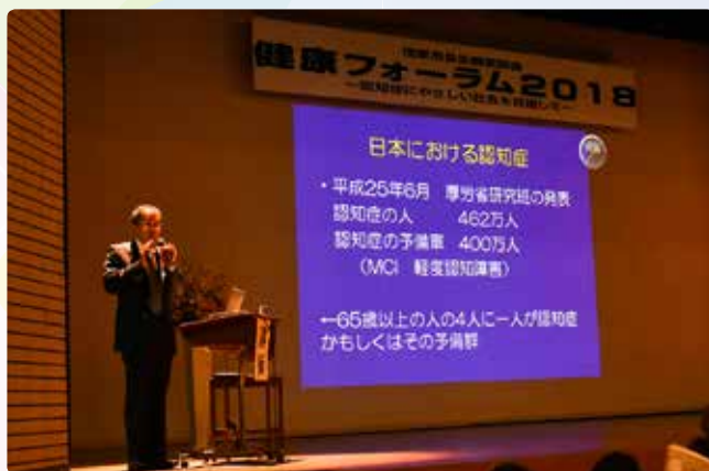
▲講演「認知症を地域で支える」