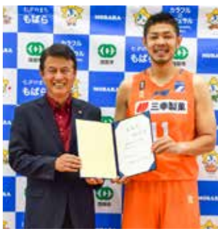
▲市長から委嘱状が手渡されました

2004年名古屋ダイヤモンドドルフィンズ入団(チームのキャプテンも歴任)その後、2017年6月新潟アルビレックスBBへ移籍(副キャプテン)ポジションは、パワーフォワード