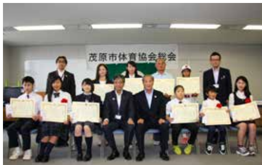
▲受賞記念の集合写真

各種大会において優秀な成績を収めた選手および団体の表彰式が、5月26日に行われました。受賞者は次の通りです。