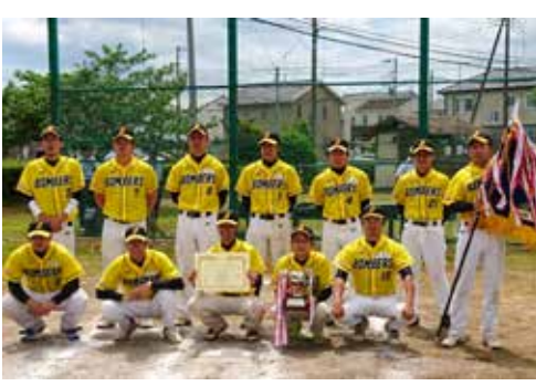
▲一般男子の部優勝 本納ボンバーズ

※一般男子の部で春季リーグ戦を制したグルービーナインズが三市一郡市(佐倉市・八街市・山武郡市・茂原市)大会へ出場、会長杯を制した本納ボンバーズは千葉県民体育大会へ出場が決定しました。