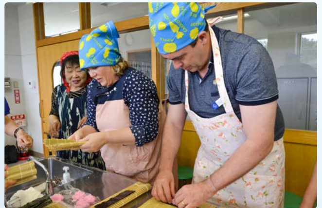
▲太巻き寿司作りを体験し、おいしくいただきました