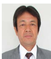
北田 茂 新治地区