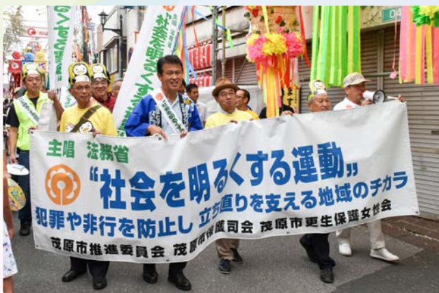
▲横断幕を先頭にアピールする参加者たち