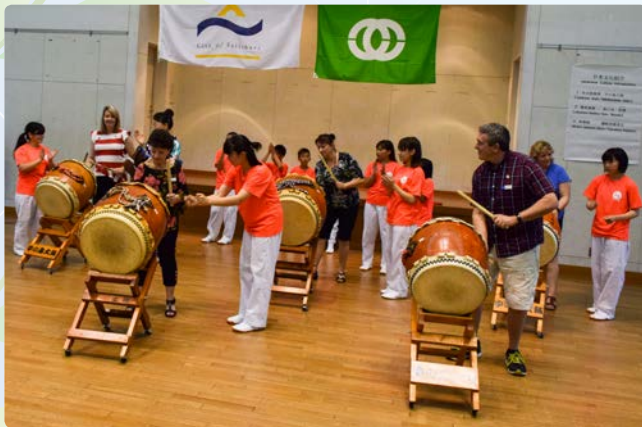
▲日本文化交流会で太鼓に挑戦する訪問団