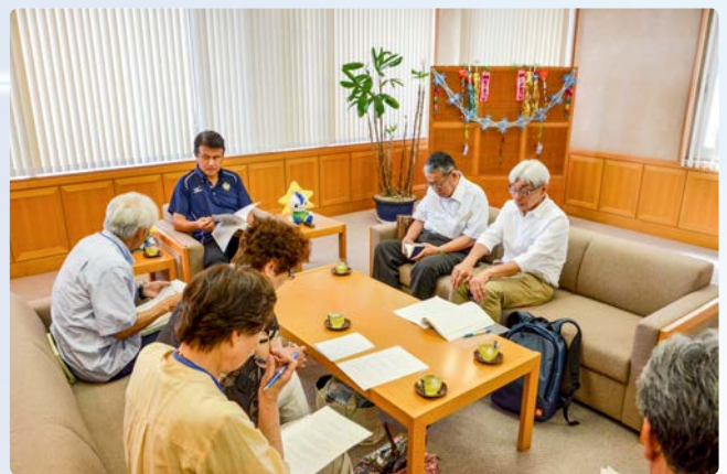
▲参加団体・グループを随時募集しています

和やかな雰囲気の中、「茂原市の子育て支援」をテーマに、待機児童の現状などについて活発な意見交換が行われました。