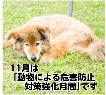
11月は「動物による危害防止対策強化月間」です