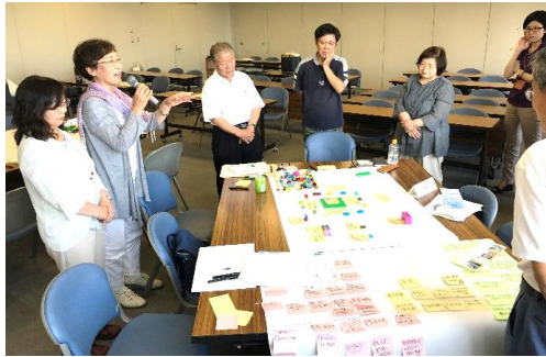
交流会（市民活動支援センターのありたい姿について）