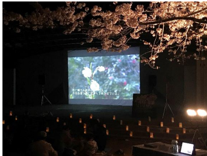
機材の貸し出し（夜桜シネマ）