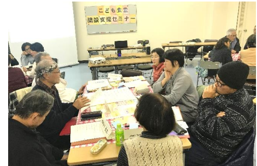
協働提案事業補助金活用事業（子ども食堂設立支援講座）