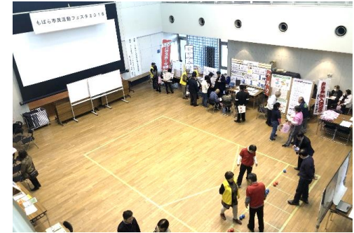
もばら市民活動フェスタ2018