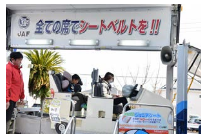
▲シートベルトの大切さを再確認できます