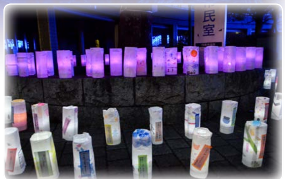
▲市内小学生が制作した「PETボトル灯籠」