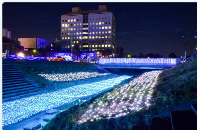
▲会場周辺が華やかな光に包まれました