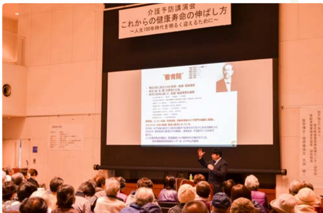
▲身ぶりを交えた講演に聴き入っていました