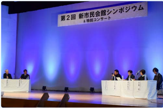
▲幻想的なライトアップの中で進行されました