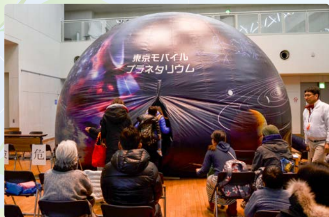
▲分かりやすい星空の解説で好評でした