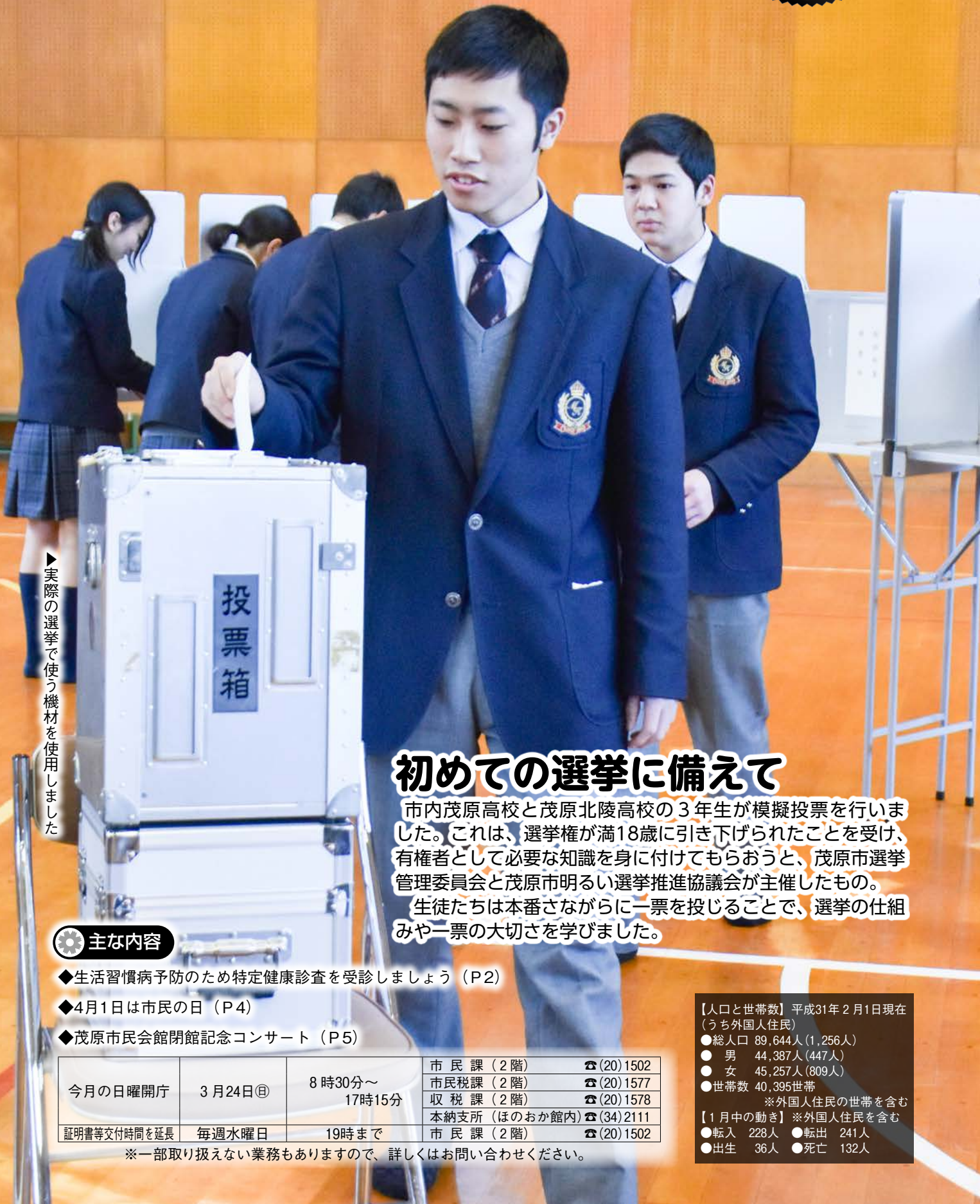
▶実際の選挙で使う機材を使用しました