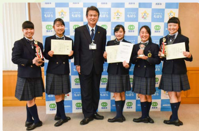
▲生徒たちの足に注目! 田中市長も頑張りました