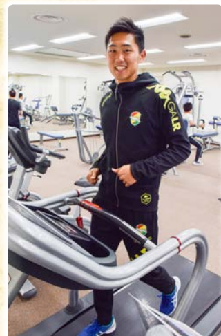
茂原市スポーツ大使の古川選手もトレーニング室を利用しています

お問い合わせは、企画政策課(4階) ☎(20) 1 5 1 6、FAX(20) 1 6 0 3へ。