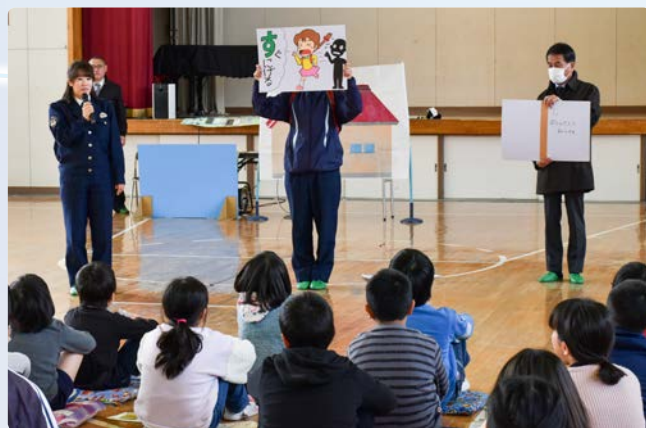
▲今年度は8小学校で実施されました

また、「いかない」「のらない」などの頭文字をとった防犯標語「いかのおすし」を署員の方から教わり、防犯意識を高めました。