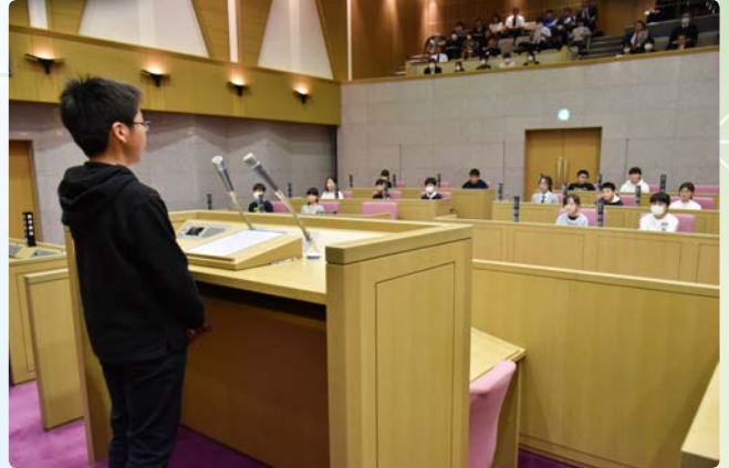
▲緊張しながらも、堂々と登壇し質問しました

実際の議会を思わせる厳粛な雰囲気の中で、児童たちは学校や地域で感じているさまざまな意見や要望を述べました。