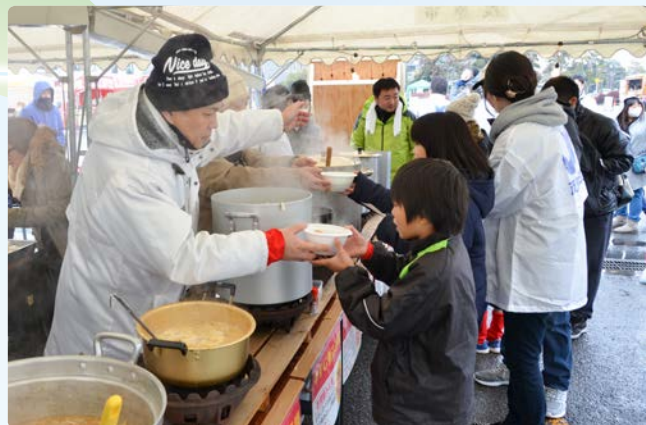
▲体がとても温まる「あったか鍋まつり」

夜には、市内小学6年生が制作したPETボトル灯籠やイルミネーションが点灯。長生郡市初のスカイランタンも実施され、来場者の注目を集めました。