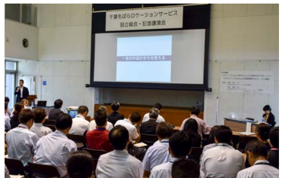
◀昨年10月に設立記念講演会を開催