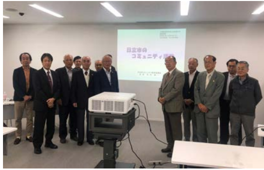
▲コミュニティ推進協議会で先進的な日立市を訪問

また、自治会の課題解決と活動内容の再確認のため毎年先進市視察を実施しており、今年度は茨城県日立市のコミュニティ推進協議会の方々と意見交換会を行いました。