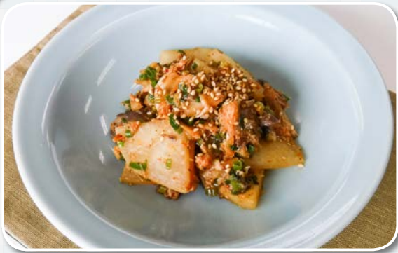
「サバ水煮缶と大根のキムチ炒め」