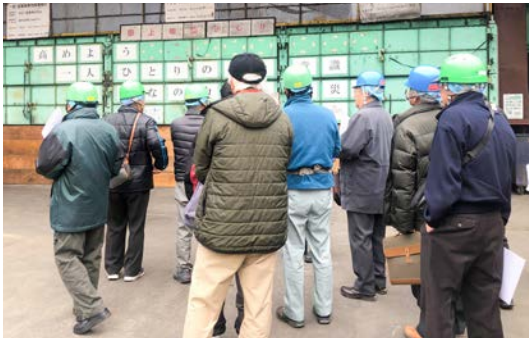
▲食品リサイクルへ取り組みみどり産業(株)を視察

今年度は、長生地域における医療問題についての勉強会を行ったほか、食品リサイクルへ取り組みみどり産業株式会社への視察を実施しました。