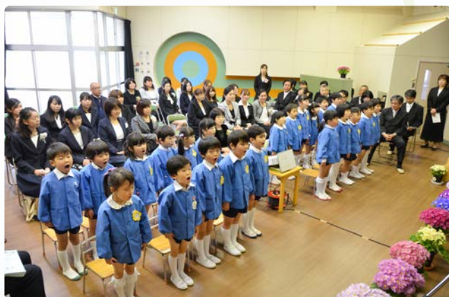
▲平成30年度卒園児による元気いっぱいの発表