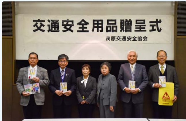
▲長生地域4市町(茂原市、白子町、長柄町、長南町)に贈呈されました