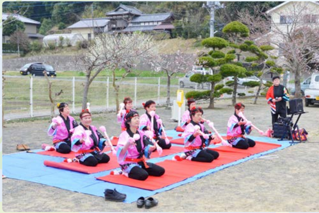
▲桜の下で銭太鼓を披露する「五郷鼓蝶会」の皆さん