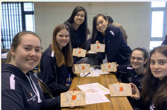
▲皆とても上手に絵馬が描けました