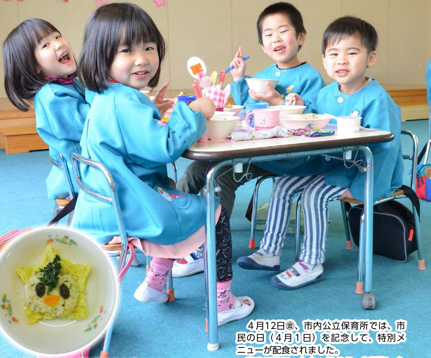
▲カレーピラフで作られた「モバリんライス」

4月12日(金)、市内公立保育所では、市民の日(4月1日)を記念して、特別メニューが配食されました。