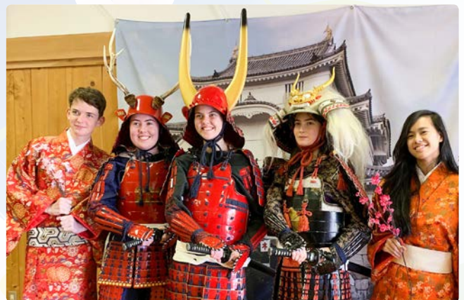
▲大多喜城では甲冑や着物を試着しました