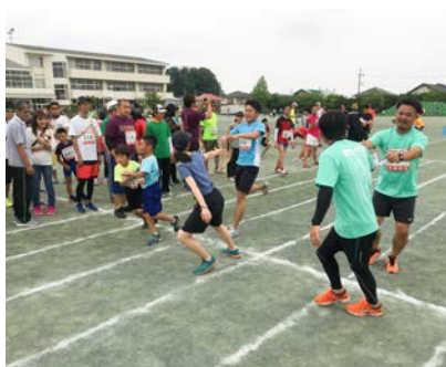
▲次の走者へたすきをリレー