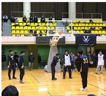
▲試合前には3×3のルール説明

3月31日①茂原市バスケットボール協会の主催によるバスケットボール3×3大会を市民体育館で開催しました。3×3とは「スリーバイスリー」と読み、2020年の東京オリンピックの正式種目となり注目されている競技です。当日は156チーム、約200人が参加し、熱戦が繰り広げられました。