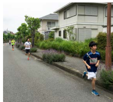
▲緑ヶ丘地区内を走ります

次の走者へたすきをリレーし、全チームが制限時間の4時間以内に笑顔で完走しました。