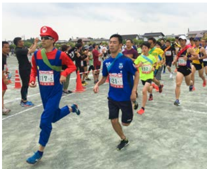
▲1位目指して！さあ、スタート！

6月2日①、緑ヶ丘小学校と緑ヶ丘地区周辺道路を会場として、第6回緑ヶ丘リレーマラソンを開催しました。市外からも多くの参加チームがあり、70チーム、571人が参加しました。当日はそれぞれのチームが、一丸となつて