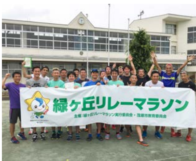
▲総合1位 TOKE ACの皆さん