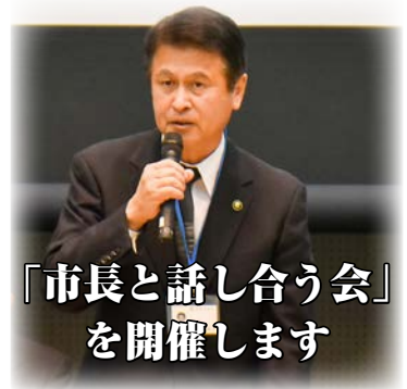
「市長と話し合う会」を開催します

本納保育所 ☎(34)3155、東郷保育所☎(22)2832、豊田保育所 ☎(22)5056、 鶴枝保育所 ☎(22)4709、二宮保育所☎(22)4894、五郷保育所 ☎(22)5539、 中の島保育所☎(24)1894、町保保育所☎(22)2544、朝日の森保育所☎(22)3126へ。