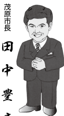
茂原市長 田中豊彦