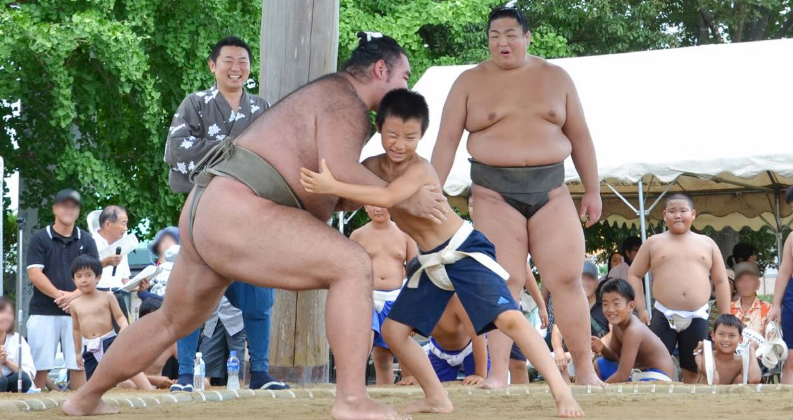
8月27日㊦、市民体育館相撲場で大相撲 鍛山部屋ふれあい相撲が開催されました。