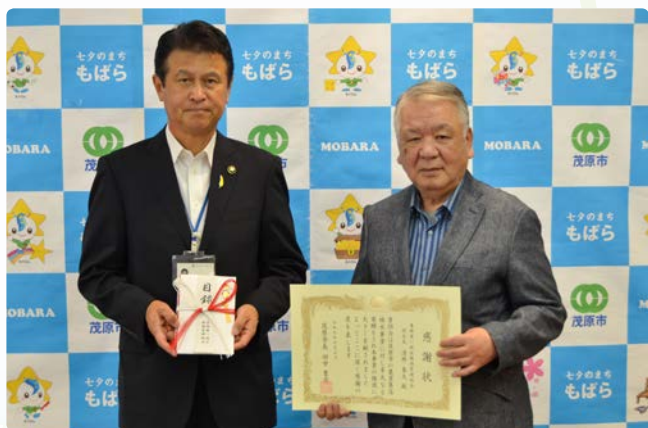
▲田中市長(左)と清野組会長(右)