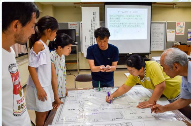
▲ペットはどこへ？物資はどこへ？

子連れ家庭や妊産婦さんが避難所で困っていることを模擬体験し、平常時から備えておくことの大切さを学びました。