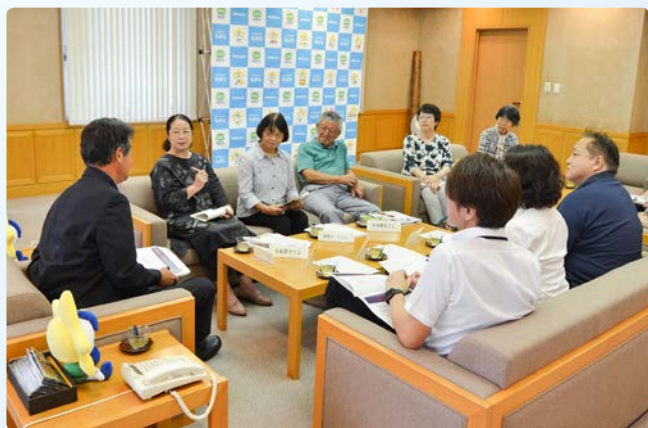
▲参加団体・グループを随時募集しています