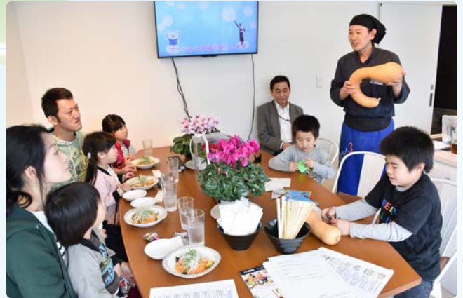
▲毎月第4日曜日に開催しています

子どもたちは食事の感想を聞かれると、顔をほころばせながら「すごくおいしい」と話し、子ども向けの食育やビンゴゲームなどで楽しい時間を過ごしていました。