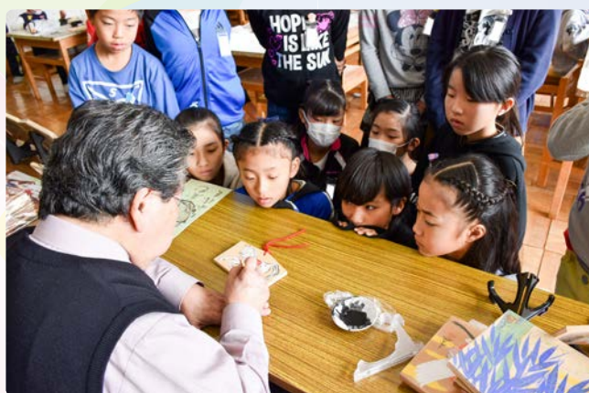
▲お手本のように描けるかな？