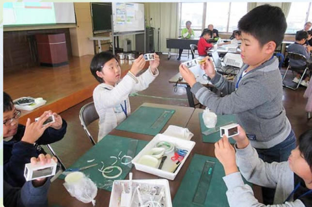
▲不思議な箱ができました！