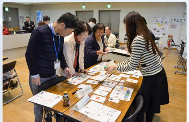
▲SDGs(持続可能な開発目標)をカードゲーム形式で学ぶワークショップ

ワークショップやスタンプラリーなども行われ、参加者や来場者は体験や情報交換を通じ、市民活動に対し理解を深めていました。