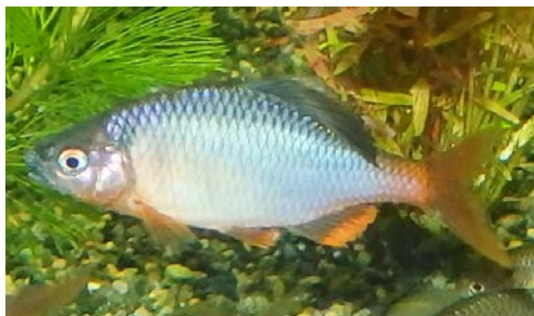
茂原市文化財審議会委員