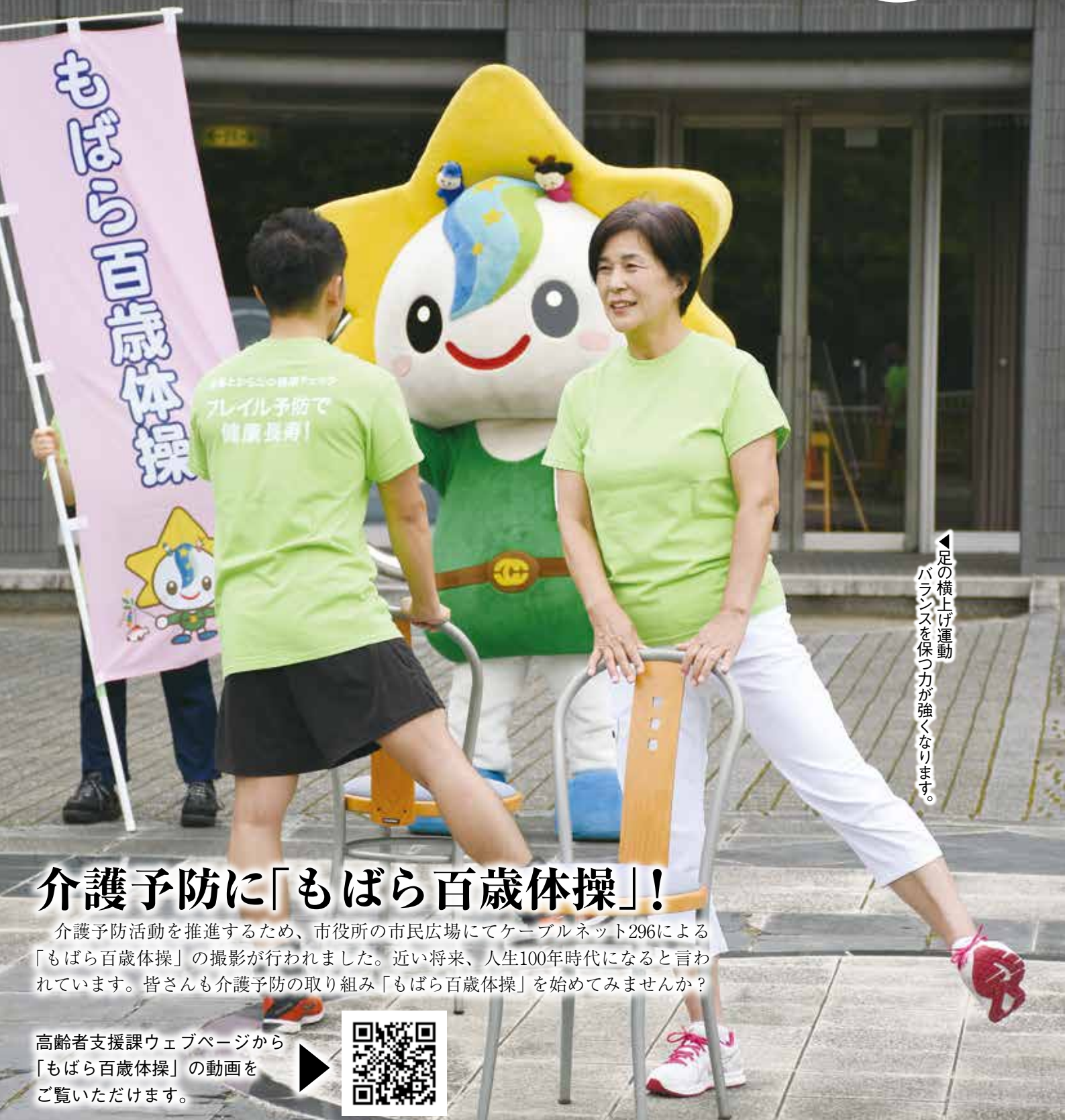
▲足の横上げ運動 バランスを保つ力が強くなります。