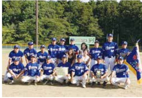
▲ラッキーウィナーズの皆さん