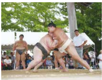
▲昨年の鍛山部屋ふれあい相撲の様子

県内においては、第5回アクアラインマラソンや第70回千葉県民体育大会が中止となりました。 本市においても、3月に開催を予定していた「第5回もばらタッチバレーボール千葉県大会」をはじめとするスポーツイベントが中止となり、また、9月から市内各所にて開催を予定していた「茂原市民体育祭」についても、感染リスクを鑑みて中止を決定しました。中止となったイベントやスポーツ大会は次のとおりです。 ・千葉県民体育大会 ・長生郡市小学校陸上大会 ・中学校総合体育大会 ・緑ヶ丘リレーマラソン ・鍛山部屋ふれあい相撲 （しんやま） ・茂原市民体育祭 など