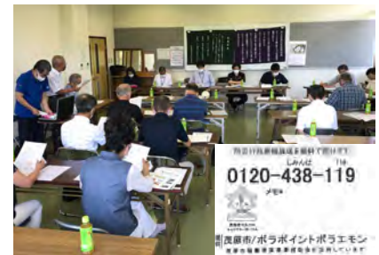
▲防災情報は冷蔵庫から！(協働提案事業)