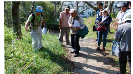
▲茂原公園生物多様性保全事業(協働提案事業)