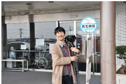
▲主人公のモデルとなった写真家・浅田政志さん(公立長生病院にて)