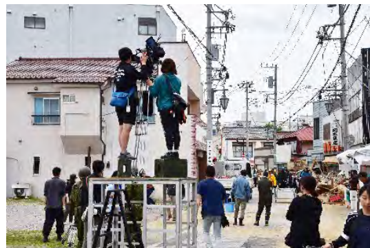
▲榎町商店街での撮影

問合せ 千葉もばらロケーションサービス (企画政策課内) ☎(20)1516、FAX (20)1603