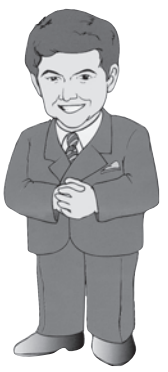
茂原市長 田中豊彦