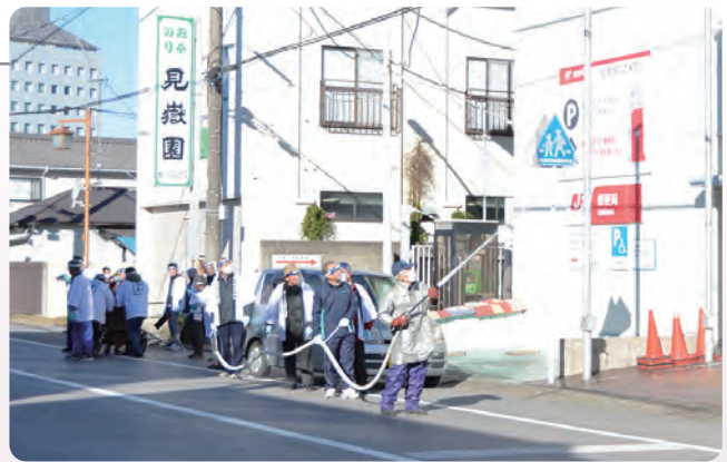
▲1軒1軒水をかけて回ります

各家庭には、水の張ったバケツが用意され、有志たちは水を継ぎ足しながら町内を回っていました。