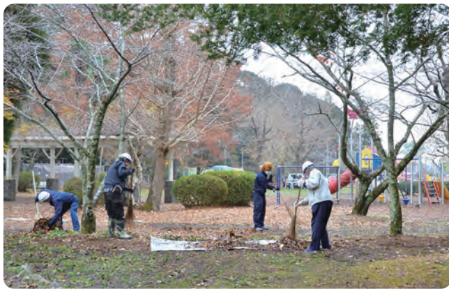
▲見違えるようにきれいになりました