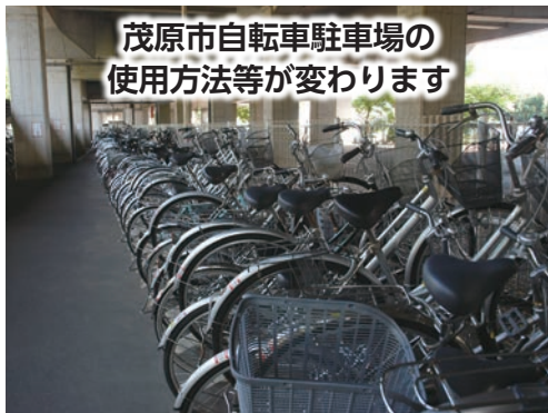
茂原市自転車駐車場の使用方法等が変わります

8月1日①から、茂原駅周辺（第1～第4）および新茂原駅前（第5～第7）の自転車駐車場の使用方法等が次のとおり変更となります。